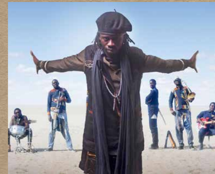
Sahad and the Nataal Patchwork

KINO · MUSIK · COMMUNITY · PARTY · THEATER